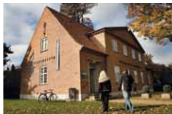
Bymuseet i Hillerød