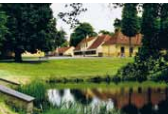
Hørsholm Egns Museum

Den 1. januar 2014 bliver Hørsholm Egns Museum en del af det nyoprettede Museum Nordsjælland. Museet slutter sig nemlig sammen med to af de andre lokalhistoriske museer i Nordsjælland: Folkemuseet i Hillerød og Holbo Herreds Kulturhistoriske Centre (HHKC) i Gilleleje. Begge museer har adskillige afdelinger og udstillingssteder, se mere på deres hjemmesider: www.folkemuseet.dk og www.hhkc.dk