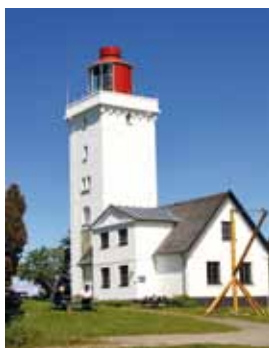
Nakkehoved Fyr, Gilleleje

De nuværende museer bliver liggende, hvor de er i dag, og beholder deres nuværende navne. Men de bliver afdelinger under Museum Nordsjælland, der skal stå for den fælles administration, og efterhånden også andre ting, der med fordel kan gøres i fællesskab.