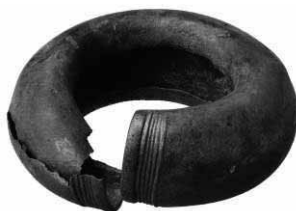
Vulstring fra Holbækvejen i Roskilde. Diameter ca. 17,5 cm.

Under efterbearbejdningen af fundene fra udgravningen blev stykkerne rensat, og kunne derefter stykke for stykke samles. Dermed blev det klart, at der var tale om en støbeform til en ret speciel genstand, nemlig en såkaldt vulstring af bronze. Vulstringe dateres til slutningen af yngre bronzealder, fra cirka år 800 til 500 f.kr.