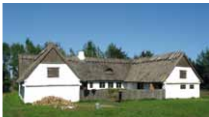
Husmandsstedet ved Sophienberg