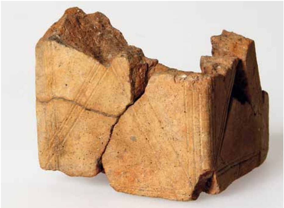
Et fast dekorationselement er et bånd af streger, der løber hele vejen rundt langs kanten, og dermed indrammer den ornamenterede flade. Denne lerblok er dekoreret på fire sider og grundfladen måler 8x7 cm.

Det gådefulde ved lerblokkene er, at ingen ved hvad jernalderbonden brugte dem til, selvom de første lerblokke i Danmark blev fundet for mere end 70 år siden. Med fundene fra motorvejsgravningerne er det dog første gang, der er fundet lerblokke på Hørsholmegnen. Fra andre landsdele kendes lerblokke i flere former og med forskellig typer af ornamentik. Lerblokkene, der er fundet ved motorvejsudgravningerne, er alle af den formmæssigt mest simple type, den rek-