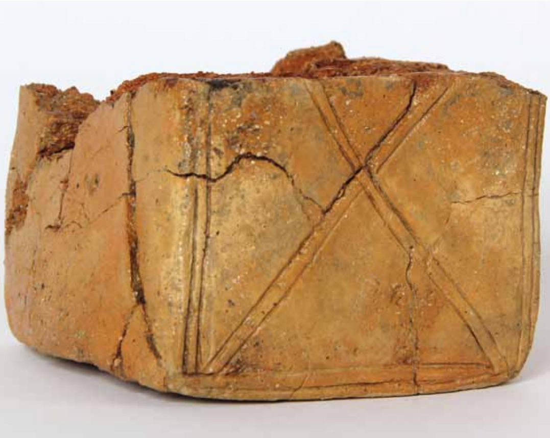
Lerblok med ornamentik bestående af bånd med kun to parallelle streger. Lerblokken har en tilsvarende ornamentering på den modstående side. Grundfladen måler 12x12 cm.

Denne variant er ofte rigt ornamenteret med bånd af streger, der danner geometriske mønstre på en eller flere af blokkens sider. Ornamentikken er skabt ved at ridse i leret, mens det endnu var blødt, hvorefter blokken er blevet tørret og til sidst brændt ved lav varme over lang tid. Ornamentikken, der ved første øjekast kan virke lidt sjusket og tilfældig, er opbygget efter faste regler og varierer kun lidt fra blok til blok.