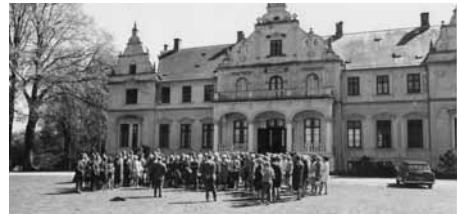
Museumsforeningen ved Kokkedal Slot 1971. Foreningen protesterede mod planerne om nedrivning.

omkring forening og museum: Museumsforeningen fik nu sin egen bestyrelse, der udelukkende beskæftiger sig med foreningens sager. Museet fik også sin egen bestyrelse, hvoraf fire var udpeget af og blandt foreningens bestyrelse, suppleret med fem medlemmer, udpeget af de tilskudsgivende kommuner. Denne ”skilsmisse” har vist sig at være lykkelig, idet den har givet forøgede kræfter til såvel forening som museum.