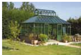
Gabriel Ash trædrivhuse