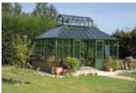
Gabriel Ash trædrivhuse