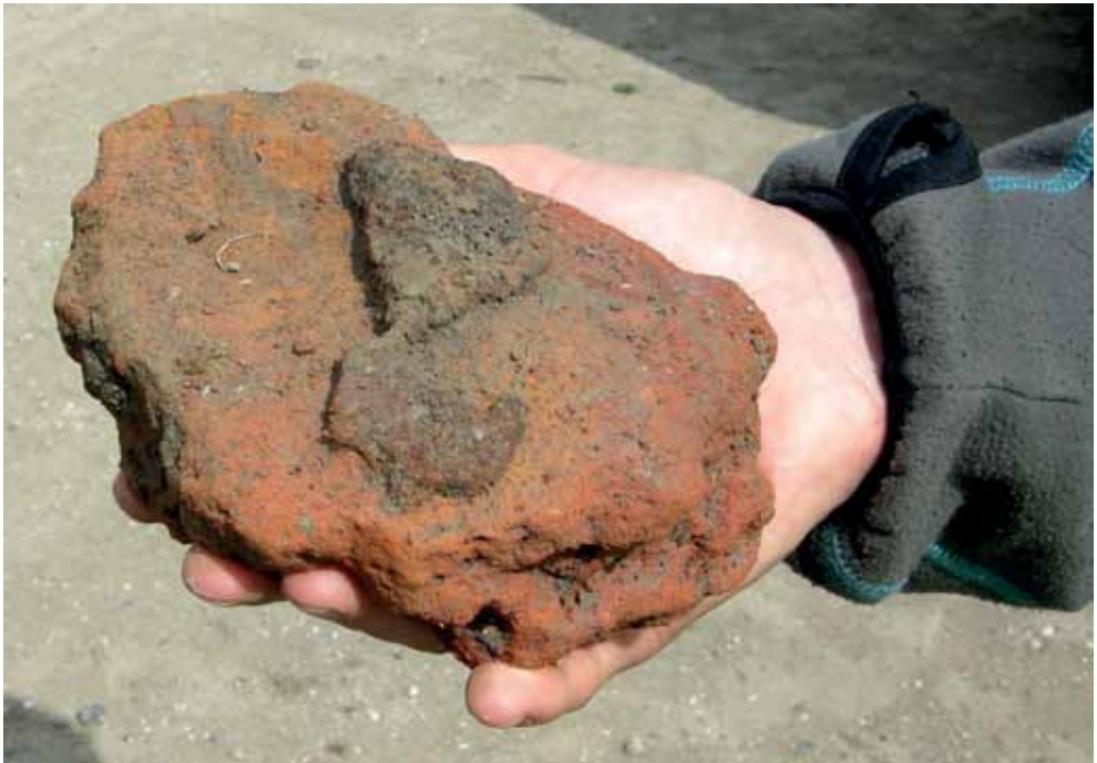
Del af en jernudvindingsovn med fastbrændt slagge.

Blandt de vigtigste fund fra bopladserne er omfattende spor efter forskellige stadier i udvinding af jern fra myremalm. Gennem hele jernalderen blev der i Danmark udvundet jern af myremalm. Myremalm indeholder jernforbindelser og dannes naturligt i kanten af vådområder, hvor den kan graves op af jorden. Jernalderbønderne ved Niverød har haft let adgang til myremalm i Langstrup mose, der ligger umiddelbart vest for bopladsområdet. Efter det store arbejde det har været at grave malmen op og