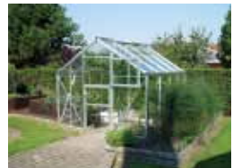
Julianas serier af hobbydrivhuse