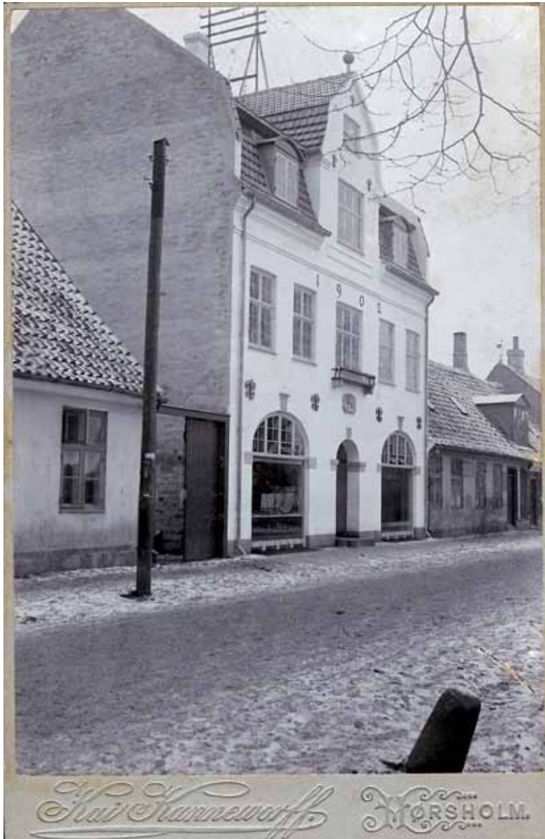
Hovedgaden 29, ca. 1915

Af Finn O. Kapel, beboer af "Plus" siden 1966