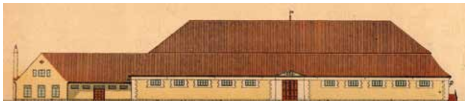
Skitse udarbejdet i 1939 i forbindelse med flytning af Ridehuset

rumme de danske kongers stutteri. Stutteriet havde hidtil været opstaldet på Esrom, men først i årene 1740-1745 blev der givet kongelig ordre til opførelse af et 4-fløjet kongelig ordre til opførelse af et 4-fløjet kompleks, som skulle rumme stalde, administrationsbygning og gårde.