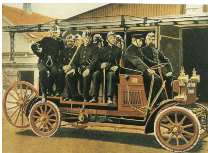
Foto: Nordens første automobilsprøjte, 1907.

Museet viser Brandvæsenets udvikling fra midten af 1800-tallet frem til i dag. Man kan se hånd-kraftsprøjter fra de gamle sprøjtehus og motordrevne brandbiler – bl.a. den danskbyggede Gideon automobilsprøjte fra 1919, Triangel-sprøjter fra 1930-erne og en officersvogn fra 1946. Udstillingen tæller også utallige genstande fra brandspande og slanger af læder over brandhager, brandhaner, strålerør, uniformer, røgmasker til beskyttelsesdragter m.m.