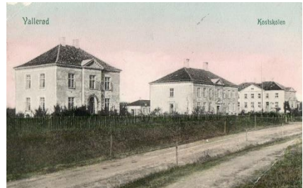
Postkort: Rungsted Kostskole (senere Rungsted Statsskole), ca. 1913.

blev den store og moderne kostskole (senere Rungsted Statsskole) opført på Vallerød Banevej.