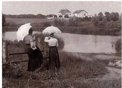
Foto: Landliggerne ved Vallerød Gadekær, ca. 1910.

lerød Banevej samt Bolbro Villavej. I 1916 var Strandvejen nord for Rungsted udstykket, og efterhånden smeltede bebyggelsen sammen med Vallerød. Andelen af pendlere her var ikke nær så høj som tilfældet var i Rungsted, men dog langt højere end i Hørsholm. Der var ikke så store indkomstforskelle som i Rungsted, og det var de mellemstore og lidt større indkomster, der prægede det sociale landskab. Områdets selvstændige karakter blev understreget af, at der i Pennehave eksisterede en håndfuld dagligvareforretninger, der gjorde det unødvendigt at begive sig ud på den lange vej til Hørsholm. Som i Rungsted var der stor forskel på årstiderne: Det var det stille vinterhalvår – og så det livlige sommerhalvår, når landliggerne rykkede ind.