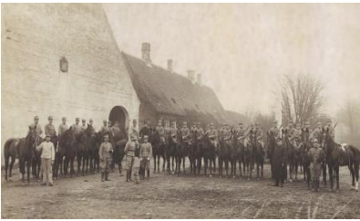
Foto: Under 1. Verdenskrig blev Hørsholm for en kort bemærkning garnison. Husarer fotografert på Sdr. Jagtvej mellem 1916-18.

I 1916 rasede 1. Verdenskrig, men Danmark havde formået at holde sig udenfor. Den danske befolkning mærkede ganske vist vareknaphed og stigende priser, men der var også nogle, der tjente rigtig godt på Danmarks neutralitet – og nogle af dem boede netop i Hørsholm Kommune.