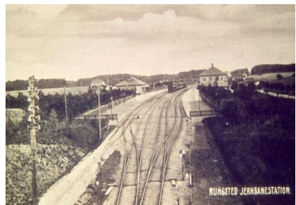
Foto: Rungsted Station, kort efter åbning af Kystbanen 1897.

Men i 1890'erne begyndte det at lysne. I årtier havde både byens erhvervsdrivende og ejerne af de store landbrug på egnen plæderet for at der skulle anlægges en forlængelse af jernbanen mellem København og Klampenborg nordpå til Helsingør. Nu blev det endeligt realiseret med anlæggelsen af Kystbanen, der åbnede i 1897.