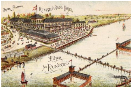
Postkort: Rungsted Badehotel, begyndelsen af 1900-tallet.

I løbet af ganske få år forvandlede det hidtil tyndt bebyggede Rungsted: