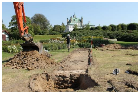
Udgravning af fasanhuset. I forgrunden ses fundamentet opbygget af flere stenlag.

Det fuldt udbyggede Fasanhus var omtrent 235 m 2 stort. Et ”hønsehuse” noget ud over det sædvanlige – hvilket vel passer sig godt for kongelige fasaner.