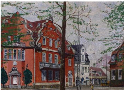
Hørsholm Rådhus (maleri, ca. 1950)

Hvis man vil have et indtryk af stemningen i Hørsholm for 100 år siden, kan man tage et kig på Hørsholms