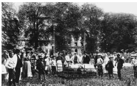
Dyrskue på Ridebanen 1908

en eskadron husarer blev indkvarteret i byen, og så blev Ridebanen en af deres øvelsesbaner. Staten har gennem alle årene ejet Ridebanen, og det er derfor Staten (nu Skov- og Naturstyrelsen), der afgør, hvad Ridebanen kan og må bruges til. Der er også begrænsninger som følge af, at Ridebanen og dens træer blev fredet i 1930'erne og fredningen revideret i 2001 i forbindelse med, at området blev renoveret, og de gamle træer erstattet af nye alléer.