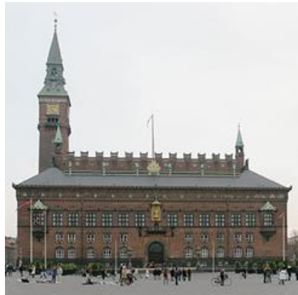
Københavns Rådhus, fra 1905