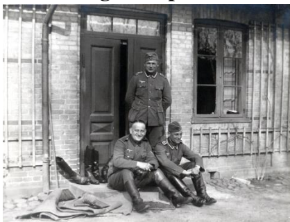
Foto: Tre tyske soldater i døren til Nebbegårds bestyrer- og kontorbolig 1940.