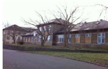
Usserød Sygehus januar 2016

Rosenstand Klahn, Museum Nord-sjælland, Hørsholm afdeling