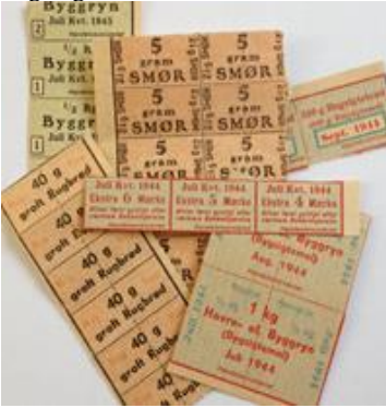
Illustration: Udvalg af rationeringsmærker.