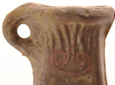
Øksens modsatte side med det Johanneskors-lignende ornament optegnet

er det fascinerende at øksen næsten fremstår som ny. Det eneste spor efter tidens tand er en let brunlig patinering af metallets yderside. Øksen er støbt i bronze og er en såkaldt celt. Celte er små arbejdsøkser, og var et af de mest almindelige bronzeredskaber i slutningen af bronzealderen. Hovedparten af de celte, der er fundet i Danmark, er af en ganske simpel type med glatte sider uden ornamenter. Her skiller den nye økse sig ud fra mængden. Fra døllens munding, hvor økseskaftet har været fastgjort i celten, ses seks ribber. På celtens ene side ender ribberne i et krumt ornament der slutter i to oprullede ender. Dette ornament blev brugt i slutningen af bronzealderen. Ornametets form har tydelige paralleller til periodens store processionsøkser og kan genfindes på andre bronzegjenstande med stor betydning. På økse-hovedets modsatte side ses et andet ornament. Dette træder ikke så tydeligt frem, men kan beskrives som et Johanneskors-lignende tegn (seværdighedstegnet) indrammet af et ufuldendt cirkelslag, der dannes af forlængelsen af to ribber.