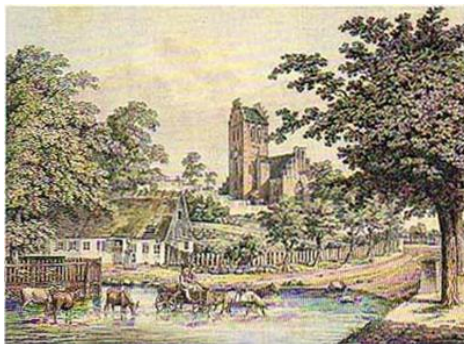
H.G.F. Holm: "Partie fra Lyngbye", 1826

Kirken er opført midt i 1100-tallet i romansk stil, med sen-gotiske øst- og vest-forlængelser samt tre tilbygninger: et højgotisk tårn mod nord, forhøjet i sen-gotisk stil, samt et sen-gotisk sydkapel og et nordkapel fra o. 1765.