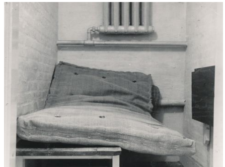
Foto af en af Gestapos celler i kælderen under Villa Strandbjerg, Rungsted Strandvej 39, senere Rungsted Strandvej 179. 1945.

Rungsted Badehotel havde i tyverne haft en blomstringstid med mange gæster og højt humør. I trediverne derimod var der flere gange tale om at rive det ned; men tyskerne beslaglagde det og brugte det i starten af krigen til indkvartering af tyske soldater, senere som en slags lazaret for sårede tyske soldater fra østfronten.